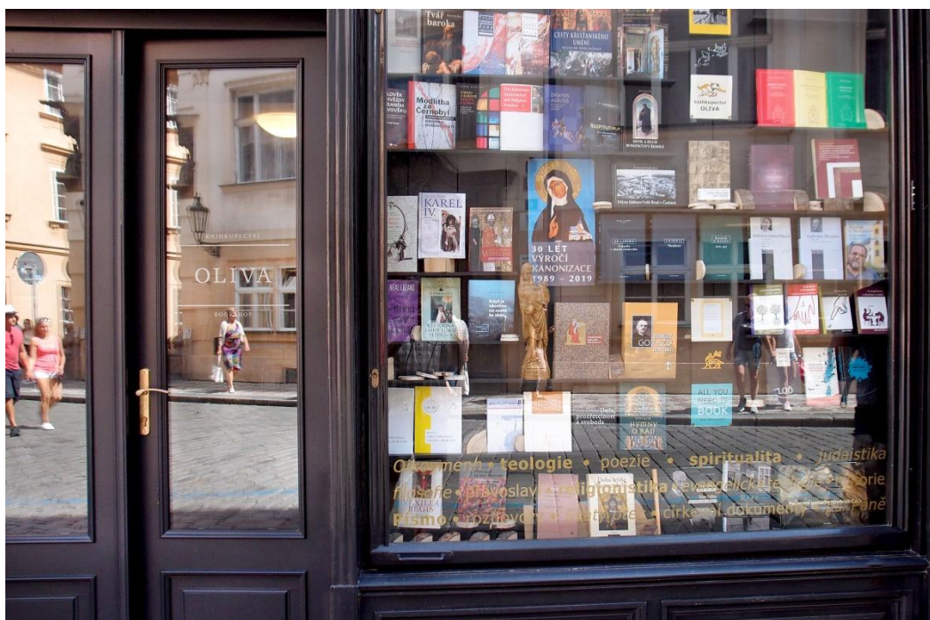
Knihkupectví Oliva na novém místě.

U příležitosti své účasti na oslavách sv. Dominika v kostele sv. Jiljí jsme se zastavili v nedávno otevřeném a nově vybaveném knihkupectví Oliva vedle krásného nového vchodu do pražského dominikánského kláštera sv. Jiljí na rohu Jalovcové a Husovy ulice. Bezbariérový vchod umožňuje pohodlný vstup i do barokního refektáře, v němž pravidelně pořádáme večery Společnosti pro církevní právo.