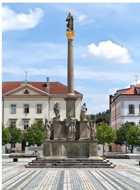
léto 2019

Dva pohledy na sloup Panny Marie na renovovaném náměstí ve Stříbře.