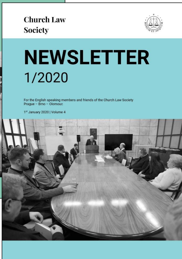
Nová titulní strana Newsletteru.