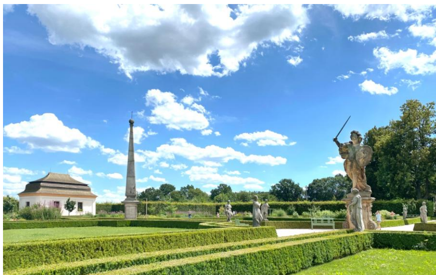
Bylinková zahrada Hospitalu Kuks, srpen 2020.