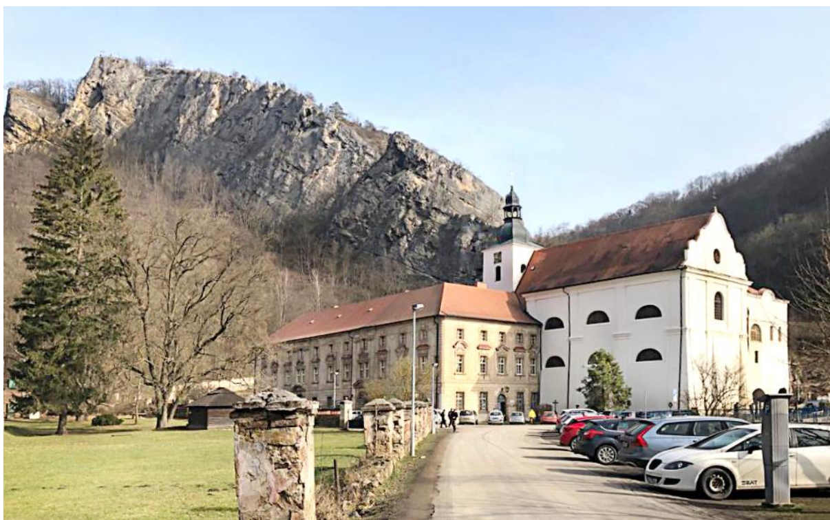
Kostel sv. Jana Křtitele ve Svatém Janu pod Skalou s přilehlou budovou církevní Vyšší odborné školy pedagogické.

V roce 1949 začala prostory kláštera využívat komunistická vláda k nápravě tzv. nežádoucích osob. Bez soudu zde byli internováni lidé nepohodlní novému režimu: „kulaci“, živnostníci, bývalí vysocí úředníci, diplomaté a jiní, kteří se měli „naucit pracovat“. Vězňové zejména docházeli na těžké práce do okolních lomů, přičemž jich několik zahynulo.