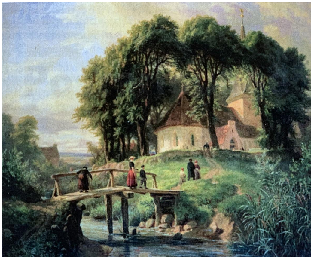
Otto Speckter: „Jdeme do kostela v Alt-Rahlstedt, 1861“. Umělecká galerie, Hamburk. Převzato z časopisu Revue de Droit Canonique, 69/2, Strasbourg, 2019.

Dnes začíná Velikonoční třídenní – triduum : večer Zeleného čtvrtka – Velký Pátek vrcholící připomínkou Umučení Páně o třetí hodině odpolední a uctěním Svatého Kříže a nakonec, po Bílé Sobotě prožité v absolutním tichu a soustředěnosti, bouřlivě radostný Svatvečer Vzkříšení Páně a celý Hod Boží velikonoční od rána až do večera. Prožijeme s celou Církví toto vyvrcholení Svaté postní doby na kolenou svých srdcí, s hlubokým ponořením do tajemství utrpení, smrti a slavného Vzkříšení Našeho Pána Ježíše Krista. Každý z nás sám i společně v kruhu svých nejbližších. Liturgických textů, které nám Církev za staletí připravila, máme dost. Přinejmenším postačí Písmo svaté a hluboké, z hloubi duše tryskající modlitby. Ti šťastlivci z nás, kteří budou moci prožít i v letošním nešťastném roce obřady v kostele, v blízkosti svátostného Krista, nechť své modlitby obětují i za všechny ostatní.