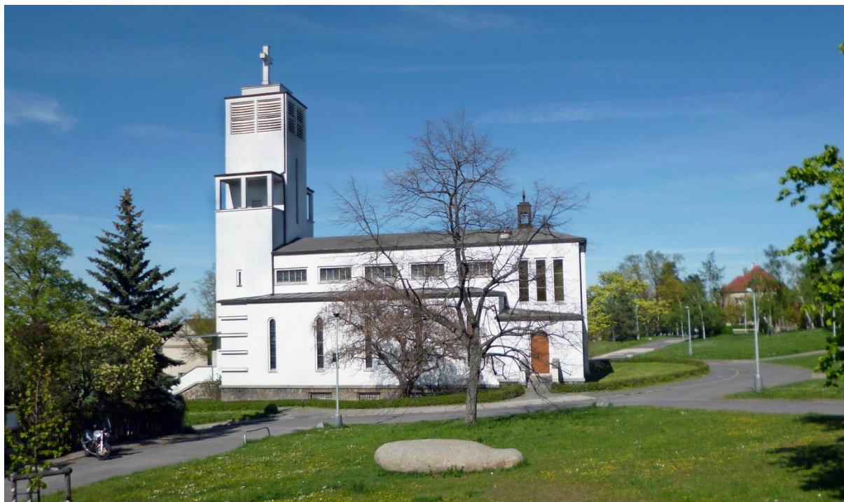
Farní kostel sv. Anežky České a svatých patronů českých v Praze na Spořilově, 9. května 2021.

českých. A není divu, že o tento kostel pečují právě bratři františkáni. Sv. Anežka, přítelkyně sv. Kláry, je přece nositelkou františkánské spirituality!