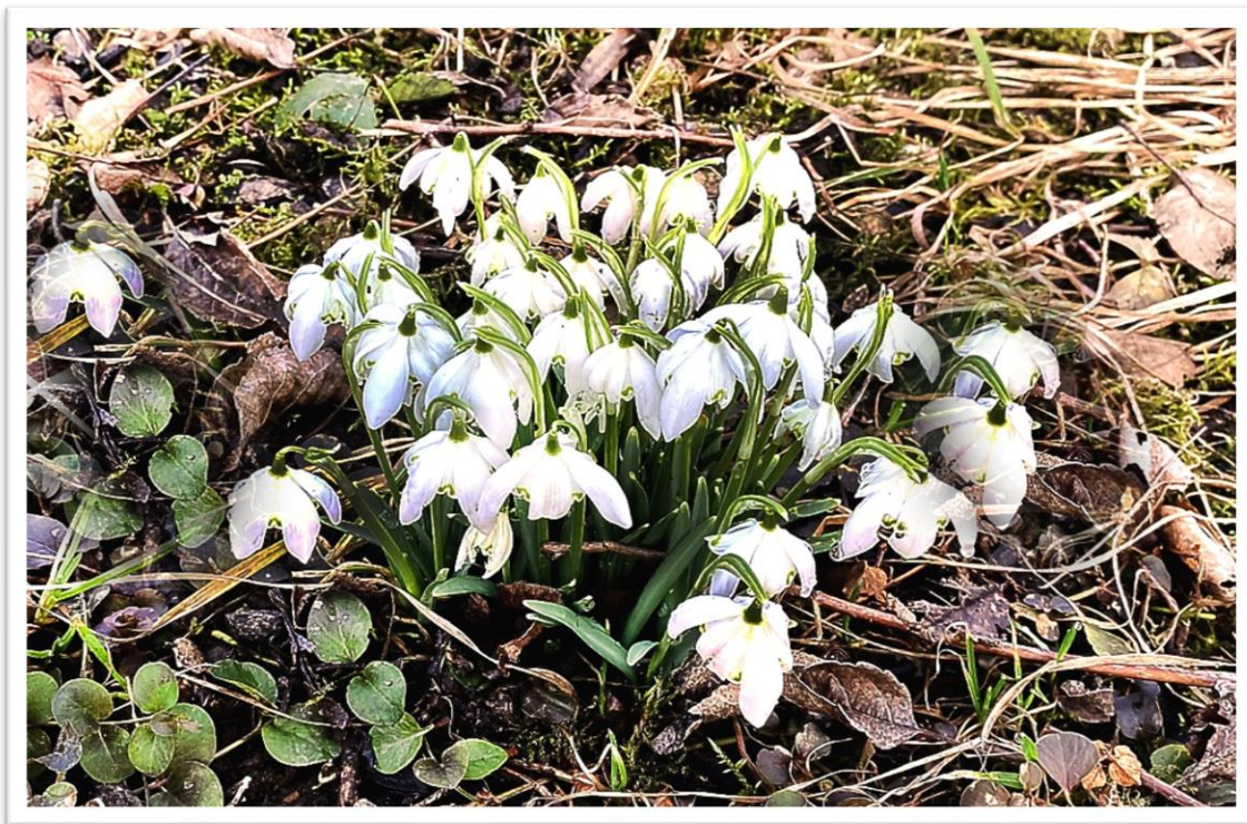
Sněženky na zahradě ve Mšeně rozkvetly už začátkem února.