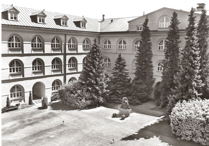
Nádvoří Katolické univerzity Jana Pavla II. v Lublinu.

Courtyard of the Catholic University of John Paul II in Lublin.