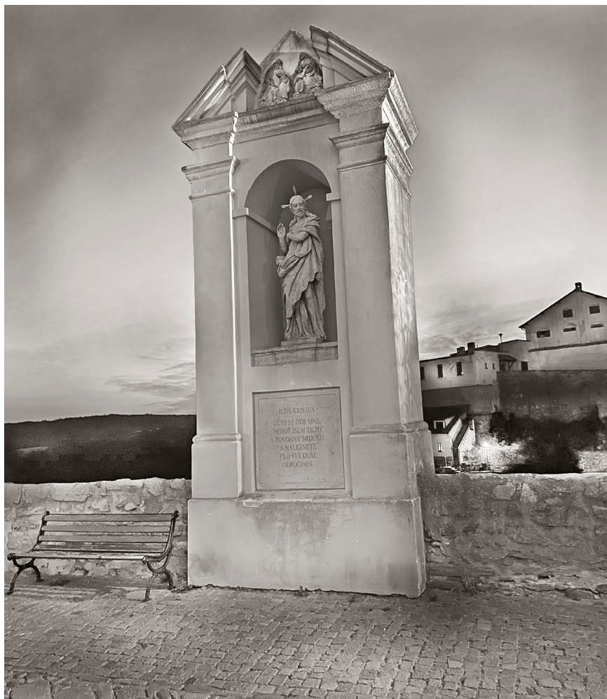
Socha před kostelem sv. Mikuláše ve Znojmě.

Statue in front of the church of St. Nicholas in Znojmo.