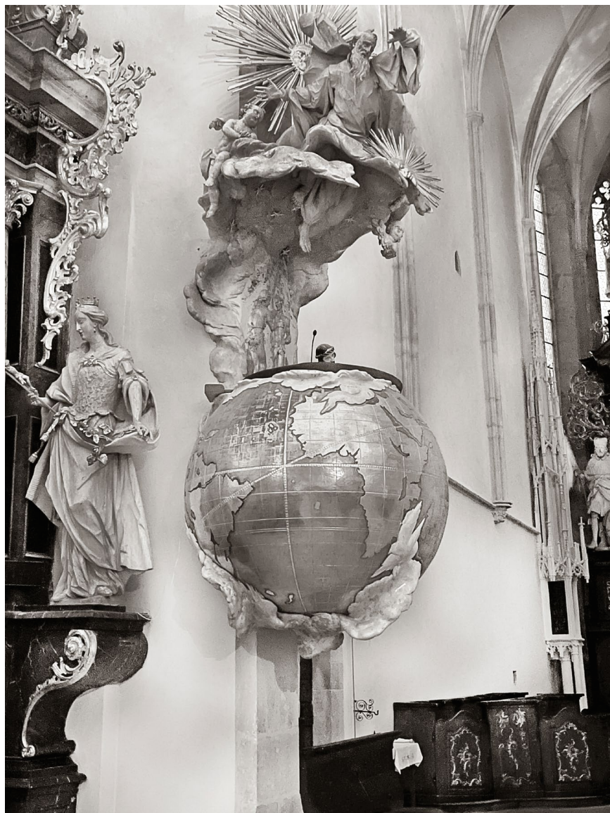
Barokní kazatelna ve tvaru zeměkoule v kostele svatého Mikuláše ve Znojmě.

Baroque pulpit in the shape of a globe in the church of St. Nicholas in Znojmo.