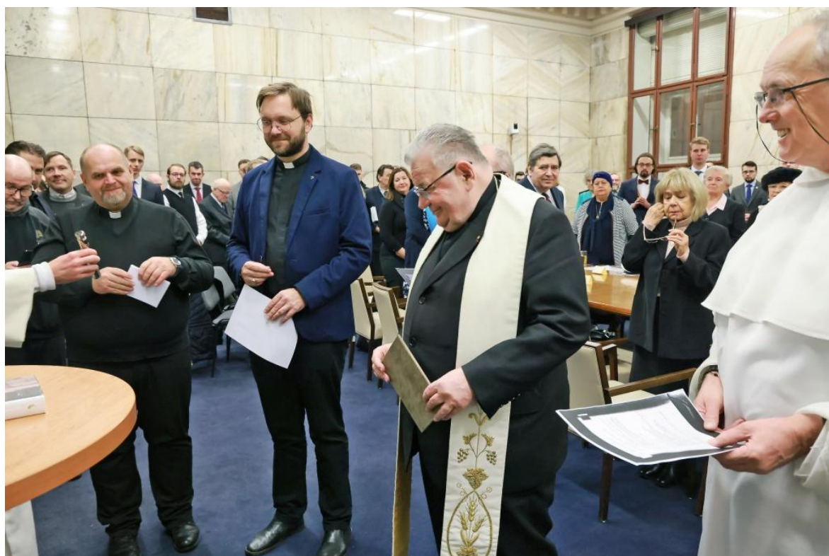
Při požehnání Českých pamětí.