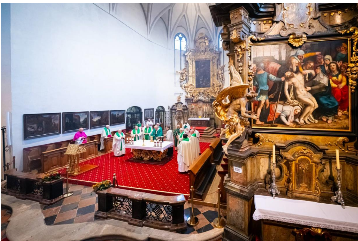
Arcibiskup pražský Jan Graubner celebruje mři svatou spolu s kolegiem kanovníků.