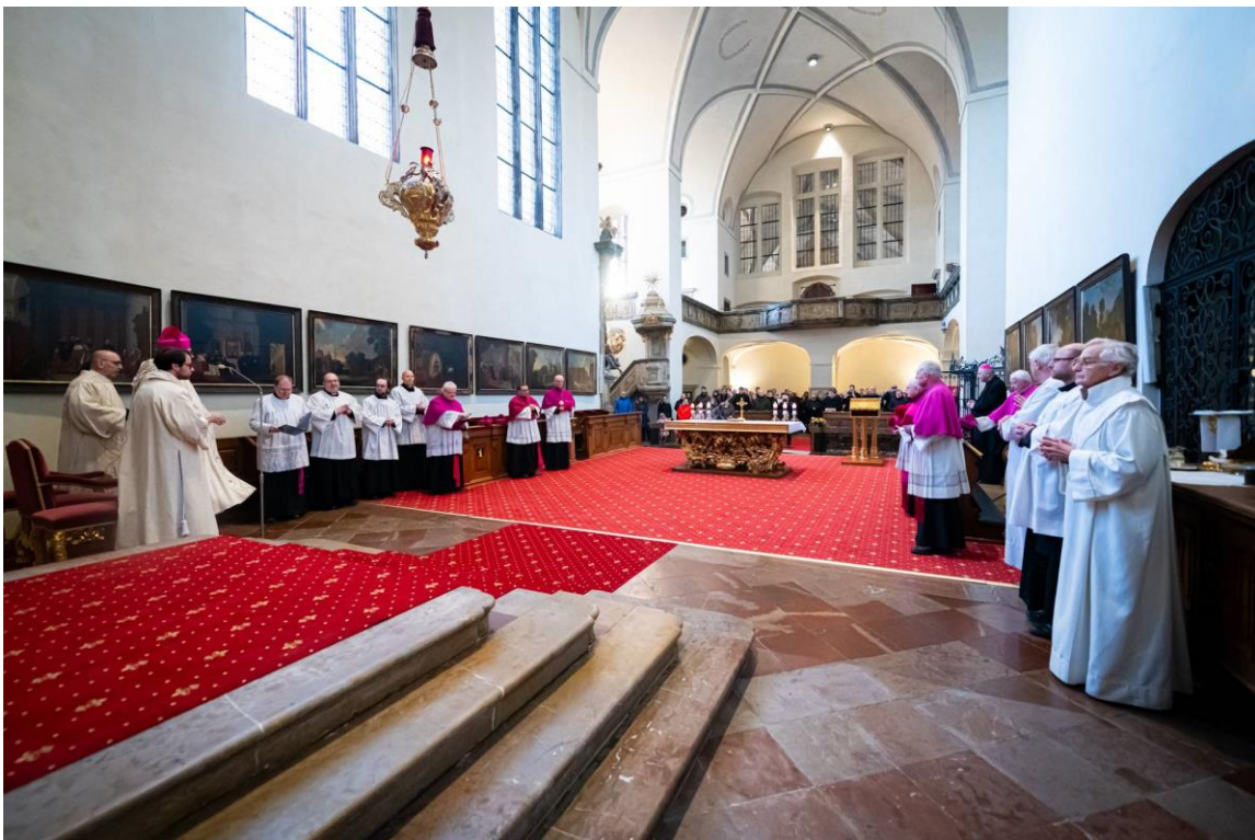
Kostel Všech svatých na Hradě pražském při slavnostním obřadu.

Po instalaci následovala mše svatá, kterou celeburoval arcibiskup Jan Graubner. Vyprošujeme novému kanovníku hojnost Božího požehnání a darů Ducha Svatého.