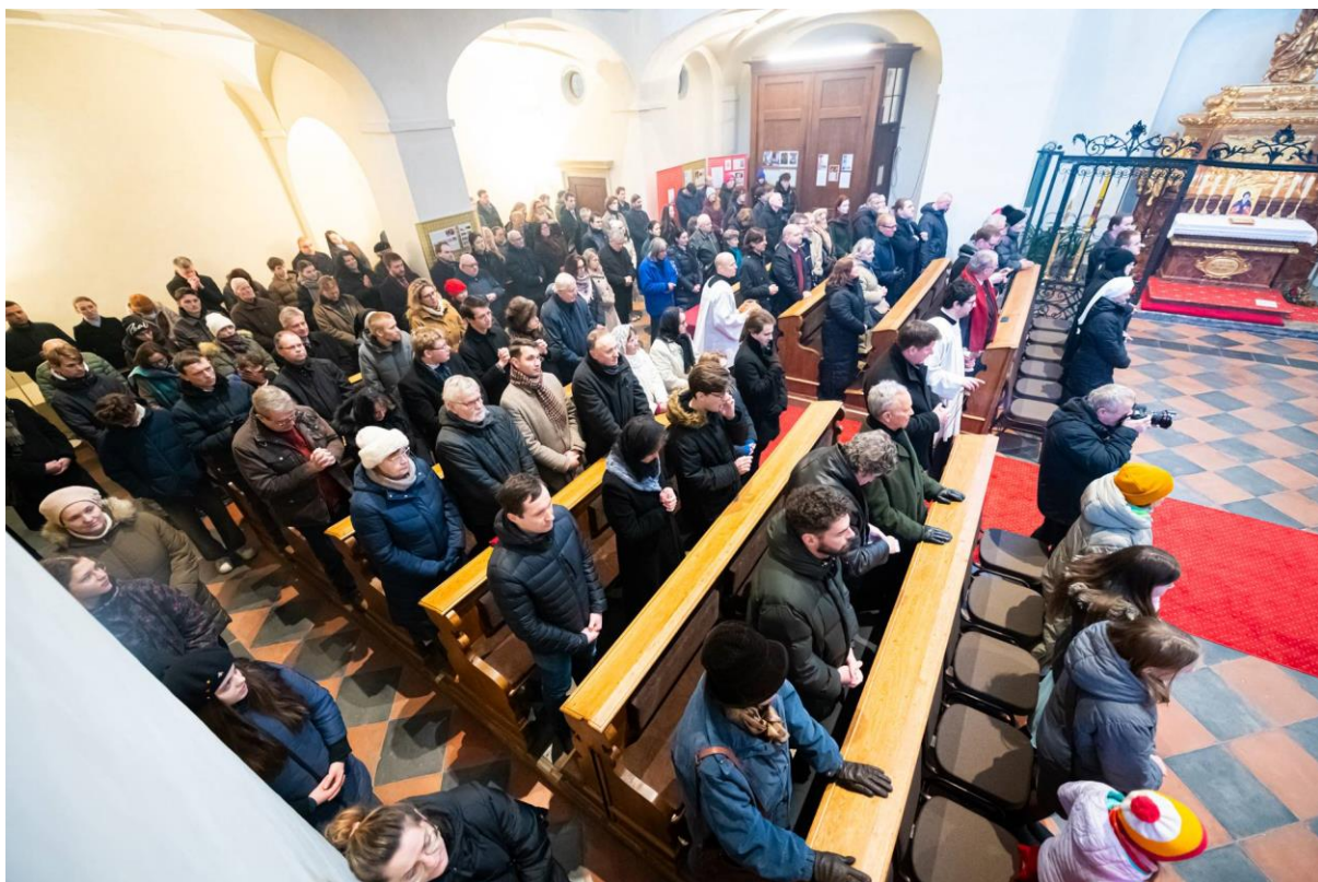
Plný kostel Všech svatých.