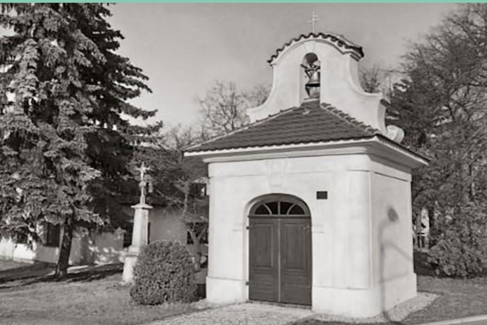
Kaple sv. Jana Nepomuckého ve Velkých Chvalovicích u Peček.