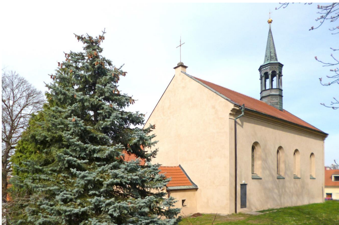
11. duben 2021: kostel Stětí sv. Jana Křtitele v Praze – Hostivaři.